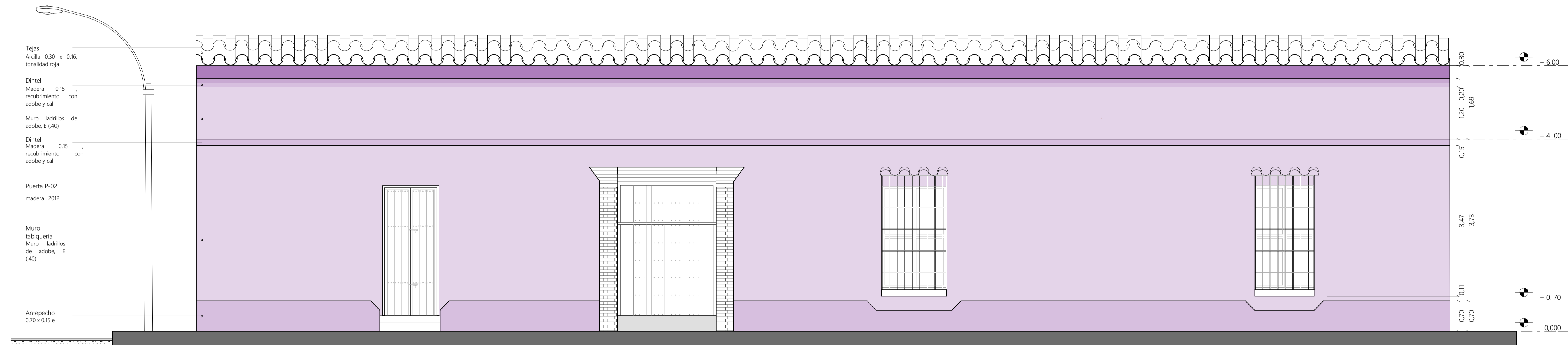
FACHADA PRINCIPAL, EXISTENTE, ESC: 1_50